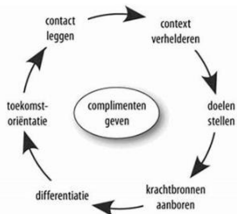
Figuur 5: de zeven-stappendans van oplossingsgericht werken (Cauffman & Van Dijk, 2014)

Ingrediënten van de oplossingsgerichte gespreksvoering zijn: